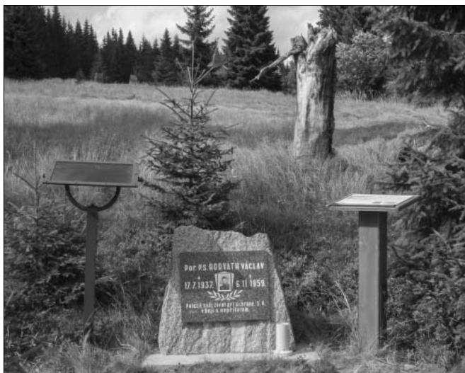
Pomník poručíkovi Pohraniční strážě Václavu Horváthovi z roku 1960, který byl na Březníku u Modravy reinstalován v roce 2010 a následně doplněn o dvě vysvětlující desky

nezná 21 a že kontroverze kolem pomníkové dedikace z roku 1960 je „možná dobrá“, protože lidé na historii Pohraniční stráže zapomínají, že ale „nejde o historii Pohraniční stráže, jde o historii železné opony“. 22 S odstupem času se u pomníku objevily dvě vysvětlující tabule (a je příznačné, že ani u jedné nejsou texty autorizovány), z nichž druhá (z roku 2014) teprve obsahuje informaci o tom, že pomník je iniciativou Klubu českého pohraničí, ale i ta se vyhýbá přesnému popisu komemorované události. 23 Její podstatnou okolností je archivně doložený fakt (a nebyl to první takový případ), že příslušník Pohraniční stráže Václav Horváth při stíhání zběha z vlastní hlídky překročil hranice do západního Německa. To bylo přirozeně v rozporu i s tehdejšími platnými zákonnými úpravami a umírající poručík si to uvědomoval: posledním povellem přikázal dalším členům hlídky, kteří jej z jeho popudu následovali ve stíhání, aby se stáhli neprodleně zpátky za „čáru“ a nezanechali tak o průniku na cizí území důkazy. 24