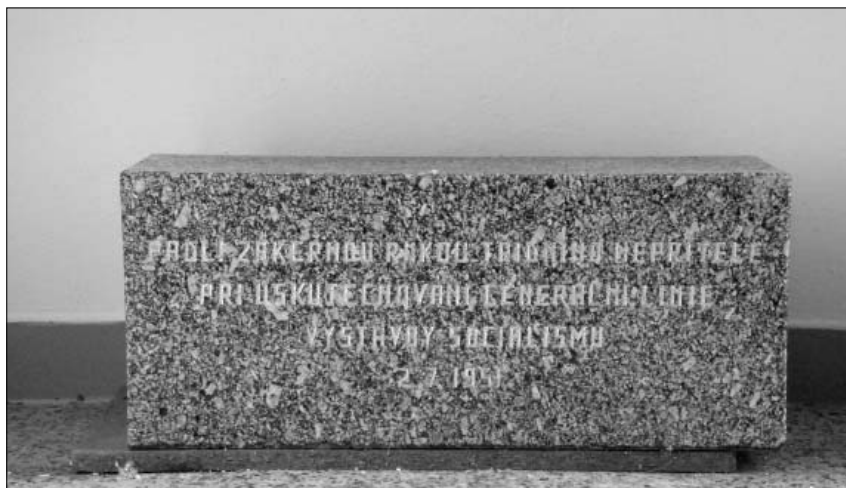
Základní kámen pomníku v Babicích byl položen v roce 1971. Vyrytý nápis oznamoval: „Padli zákeřnou rukou třídního nepřítel při uskutečňování generální linie výstavby socialismu“