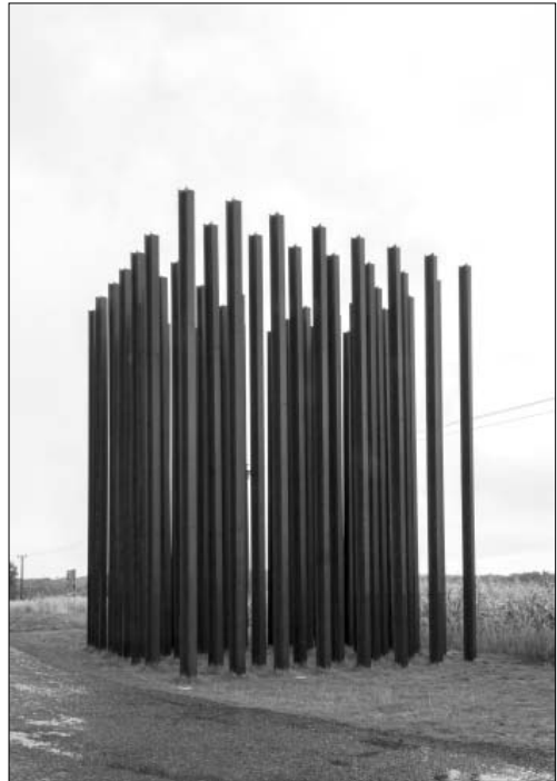
Památník „Brána ke svobodě“ nedaleko česko-rakouského hraničního přechodu Mikulov / Drasenhofen, který je dílem architektů Tomáše Pilaře a Ladislava Kuby, sestává z třiapadesáti kovových stél. Na každé je laserem vypáleno jméno jedné oběti železné opony na jižní hranici

Druhá linie kritiky, jež se vine publikační produkcí Klubu českého pohraničí, směřuje k Havlovi vyjádření omluvy za vyhnání českých Němců (v tomto postoji ovšem klub není zdaleka osamocen). Všechny komemorační akty česko-německého, či spíše německo-českého smíření i soukromé iniciativy bývalých německých obyvatel pohraničí, kteří zde