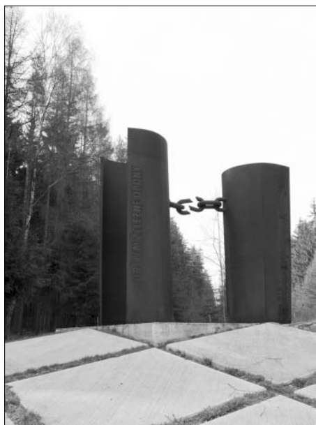
Památník u hraničního přechodu Svatý Kříž na Karlovarsku a Waldsassen v Bavorsku, který v roce 2006 vytvořil akademický sochař Antonín Kašpar ve spolupráci s architektem Jaroslavem Šustou, nese jména dvaosmdesáti obětí železné opony na západní hranici

Hranice jsou hlavně místem paměti na československo-československý konflikt, v němž ve většině případů byla ozbrojena jen jedna strana. Počet 280 úmrtí (jak udává ÚDV), či v marginální korekci 276 úmrtí (na základě nejnovější dokumentace