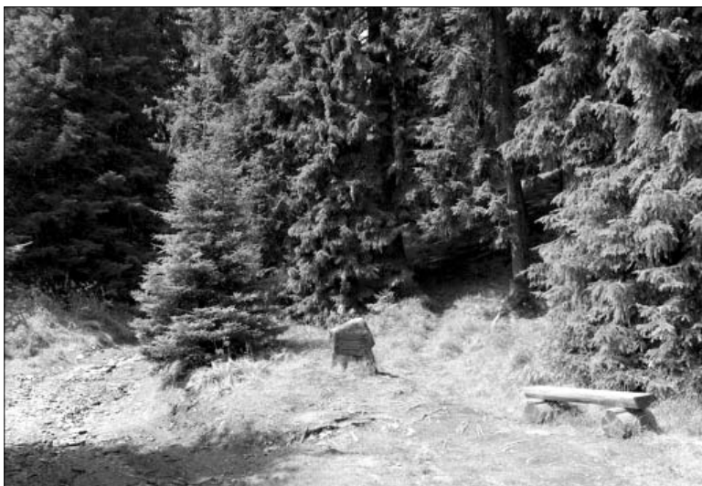
Pomník českým a německým převaděčům v šumavské Kvildě-Františkově, odhalený roku 2004. Pamětní nápis připomíná: „Touto stezkou opouštěli svobodomyšlní občané svou vlast po únoru 1948. Věnováno Čechům a Němcům, kteří je s nasazením života převáděli.“