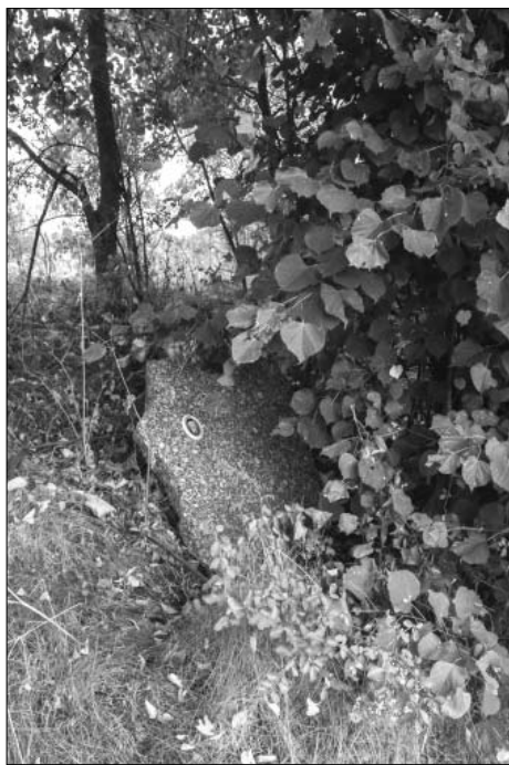
Pozapomenutá připomínka vraždy v Koubalově Lhotě: pomník na autentickém místě z poloviny sedmdesátých let