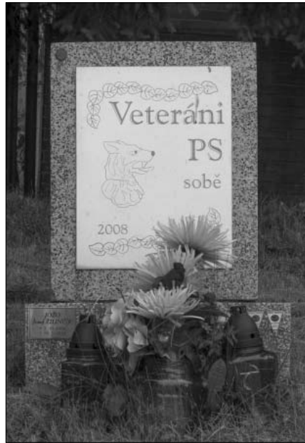
Pomník veteránům Pohraniční stráže ve Stálkách, odhalený roku 2008 před budovou bývalé 2. roty znojemské brigády vojáků základní služby, kteří zde sloužili na konci osmdesátých let