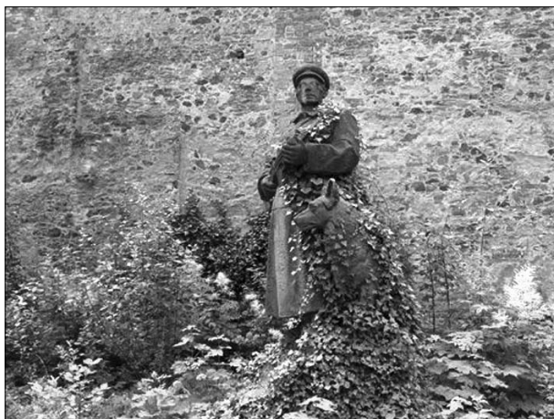
Současná podoba pomníku „Na stráži míru“ z roku 1955 od akademického sochaře (později národního umělce) Jana Hány. Po několika přesunech našel útočiště ve dvoře františkánského kláštera, který slouží jako lapidárium Muzea Cheb

symboliku – robustnost pohraničnicka v nadživotní velikosti (lidově označovaného „golem“) ozbrojeného samopalem demonstrovala sílu nového vojskového strážení hranice, emblematický pes u jeho nohou odkazoval na chodskou tradici, již Pohraniční stráž přijala za svou. 9